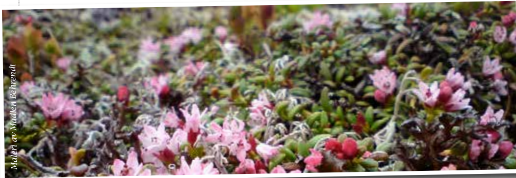
Malen av Madlen Behrendt