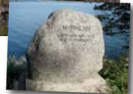
Minnestein over myrmenn på Ekne i Levanger kommune.

sammen og bnr. 6 ble slettet. Vi får tro vedkommende som kjøpte tomte brukte stemmeretten sin. I våre dager, da vi tar stemmeretten for gitt, er det dessverre mange som ikke gjør det.