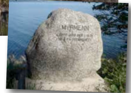
Minnestein over myrmenn på Ekne i Levanger kommune.

sammen og bnr. 6 ble slettet. Vi får tro vedkommende som kjøpte tomta brukte stemmeretten sin. I våre dager, da vi tar stemmeretten for gitt, er det dessverre mange som ikke gjør det.