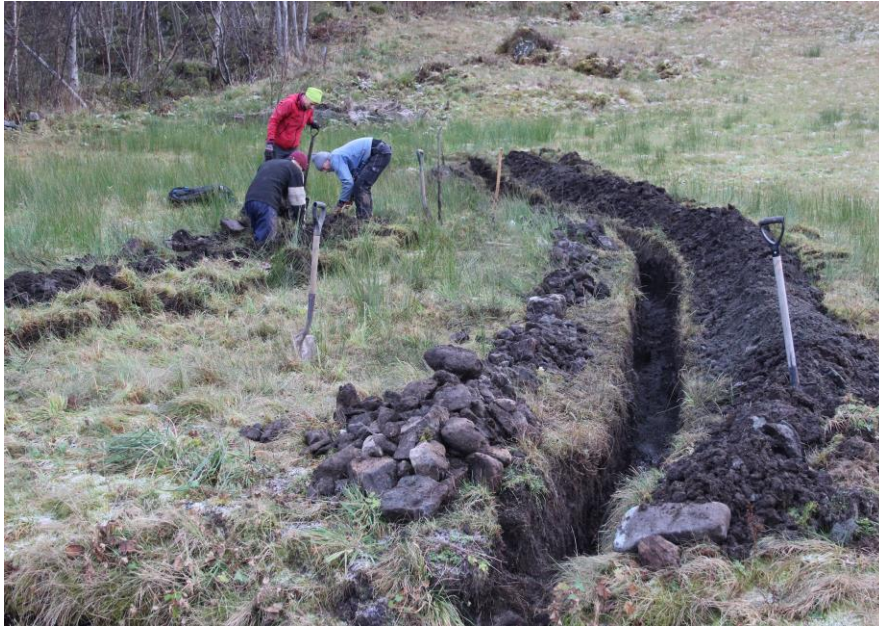
Grøftearbeide på Stokke haust 2014